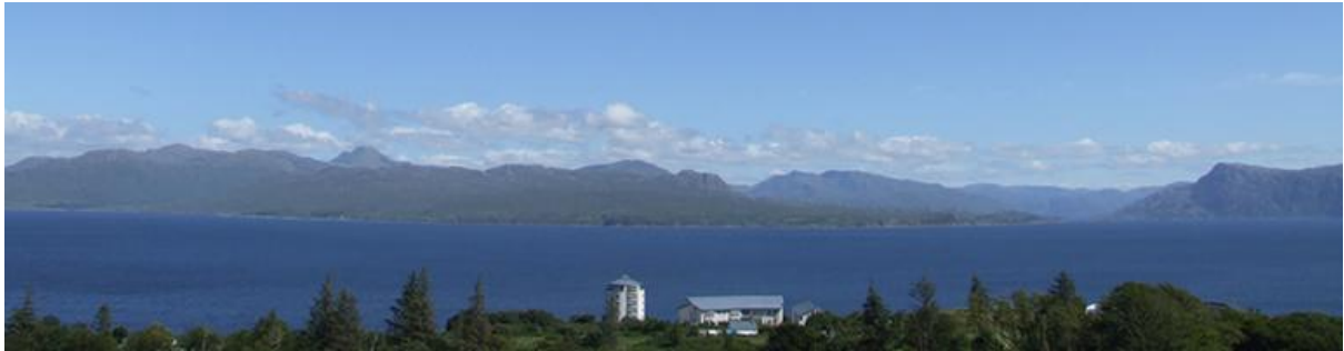
Sabhal Mòr Ostaig