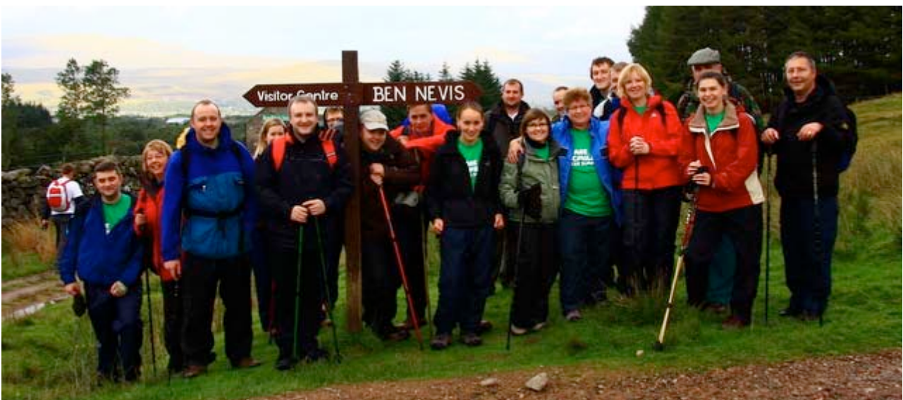
Luchd-obrach Fèisean nan Gàidheal air an slighe gu ruige mullach Beinn Neibheis